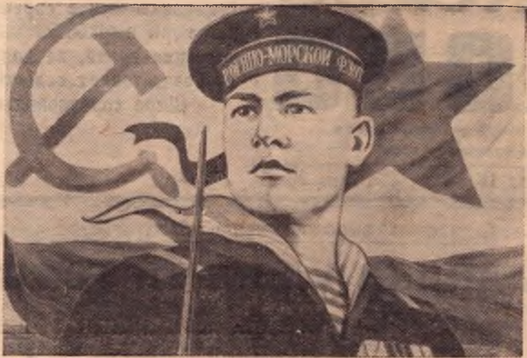
Защитникам морских рубежей Советского Союза—слава!